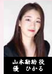
山本勘助 役 優 ひかる