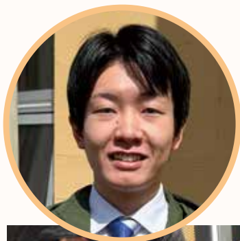
小菅村 総務課 企画担当 主事