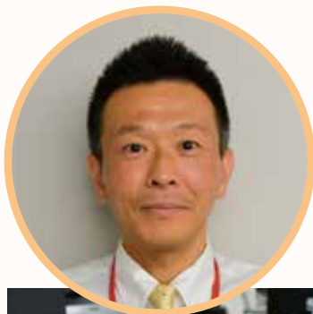
丹波山村 教育委員会 社会教育担当 主査

小菅村は小さな自治体のため職員数も少なく、一人が複数の業務を兼務しなければなりません。担当業務を並行して進めていくことの難しさを日々感じています。成長を感じられることも多いです。職場の先輩方にご指導いただきながら経験を積んでいき、村の発展に貢献できるような職員を目指して精進していきます。